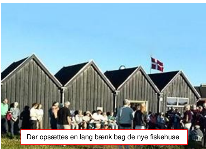
Der opsættes en lang bæk bag de nye fiskehuse

Pas på vores fælles natur ....Hold hund i snor