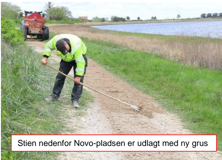
Stien nedenfor Novo-pladsen er udlagt med ny grus