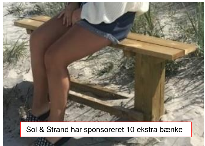
Sol & Strand har sponsoreret 10 ekstra bænke