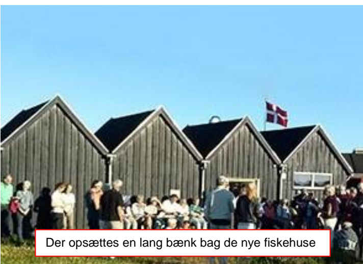
Der opsættes en lang bæk bag de nye fiskehuse

Pas på vores fælles natur ....Hold hund i snor