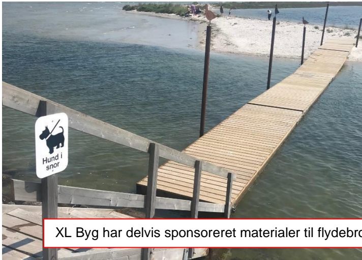
XL Byg har delvis sponsoreret materialer til flydebro syd for havnen, og vi har fået støbt en gangsti i beton.

På billederne nedenfor vises resultater af de projekter/forbedringer, som Strandlauget har foretaget